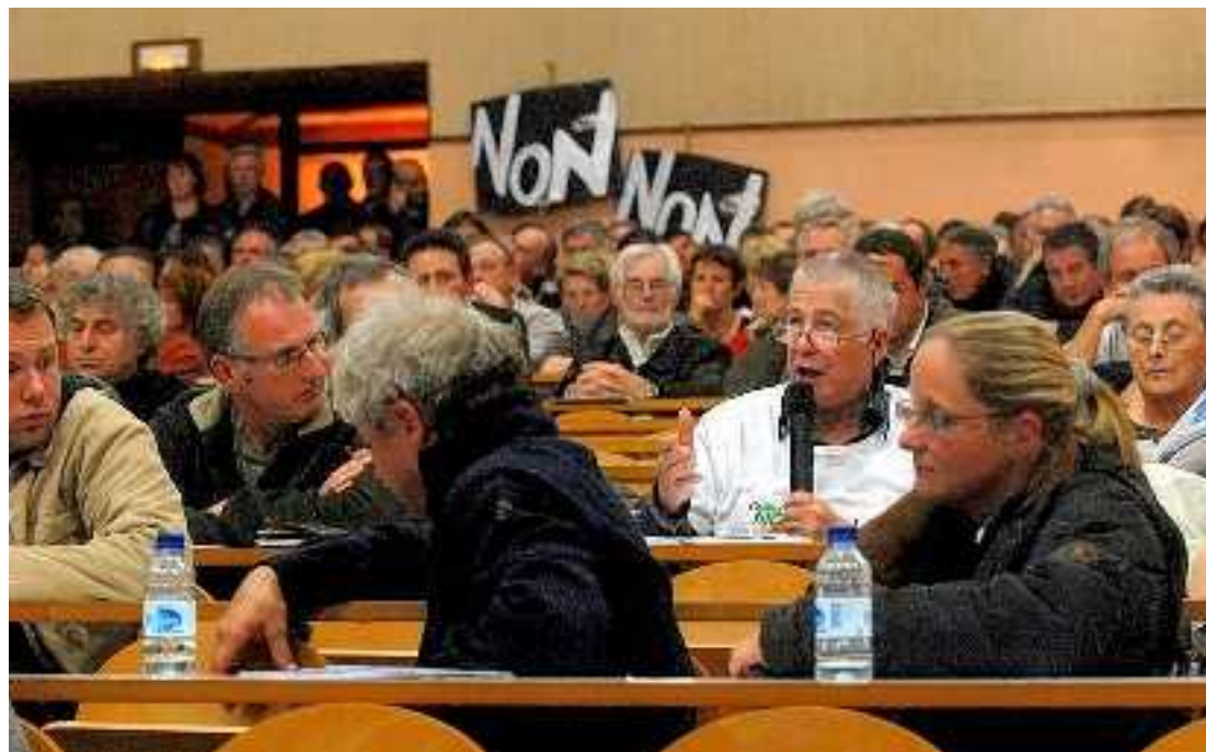
A l'exception d'un habitant du Sud-Vienne, on n'a pas entendu la voix des personnes favorables à la ligne à grande vitesse hier soir dans l'amphithéâtre de la fac de Sciences Humaines à Poitiers.

Les questions ont porté sur toutes les caractéristiques du projet : un investissement de 1,3 milliard d'euros (chiffre 2005) pour une ligne de 125 kilomètres dont 115 en site neuf et sur une voie unique parcourue en 35 minutes (1 h 50 de Limoges jusqu'à Paris sans arrêt à Poitiers, 2 h avec arrêt à Poi-