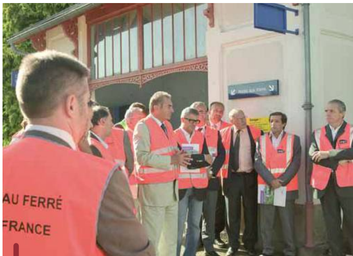
Visite du chantier de la ligne Limoges-Guéret. 25 millions de travaux pour que les trains roulent à nouveau à 110 km/h. Le trajet Bordeaux-Lyon s'en trouvera raccourci de quelques minutes supplémentaires.