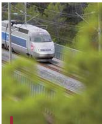
Le projet est déjà bien avancé. En octobre, on connaîtra le tracé définitif. La Région sera attentive à ce que l'impact sur le paysage et l'environnement soit mineur. L'emprise des voies est de 30 mètres de large seulement.

En 2006, la Région Limousin avec le Centre et Midi-Pyrénées commandent une étude pour connaître les réelles possibilités d'améliorations de la ligne historique Paris-Orléans-Limoges-Toulouse (POLT). Le verdict est sans appel : des gains de temps sont possibles, mais pour un prix supérieur à celui du barreau Poitiers-Limoges.